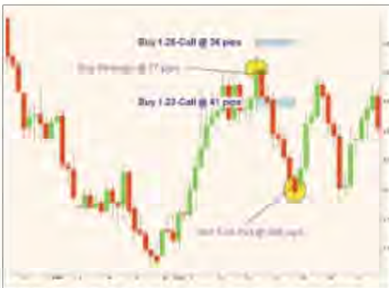
Рис. 4. Покупка 9-дневного стрэнгла на USD/CAD.

Поскольку потери могут быть неограниченными, то в запасе у опционного трейдера всегда должен быть инструмент покрытия риска. Им является стоп-приказ на покупку или продажу валюты.