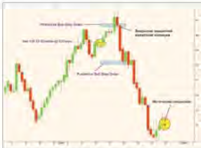
Рис. 5. Продажа стрэддла на EUR/JPY и общий принцип управления риском.

В случае стрэнгла лучше ориентироваться на цены исполнения опционов. Премия, полученная от их продажи, обычно бывает небольшой. Поэтому запаса прочности на предмет возникновения убытков в случае выхода за точки безубыточности у короткого стрэнгла почти нет. Дальнейшее управление риском следует строить, что называется, по обстоятельствам.