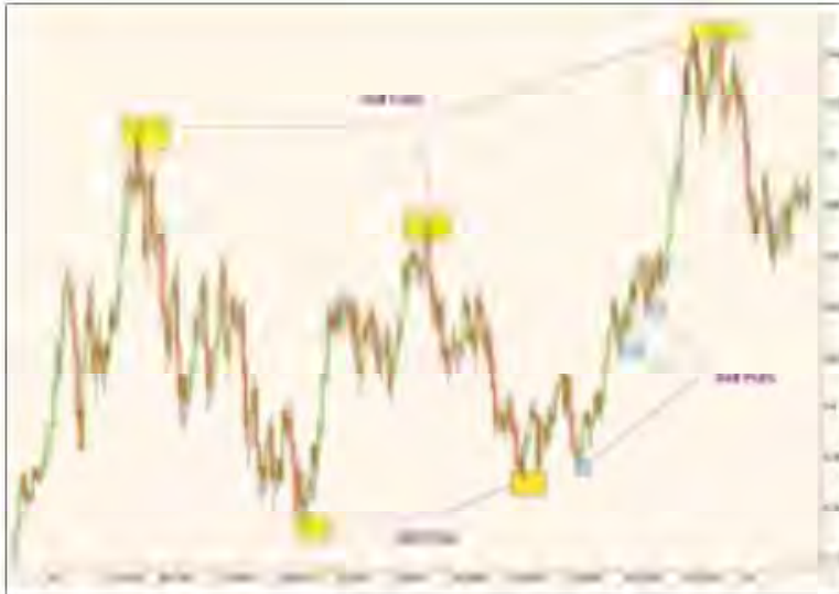
Рис. 3. Продажа одиночных опционов на GBP/USD.

за счет продажи нескольких опционов, чем использовать один долгосрочный опцион.